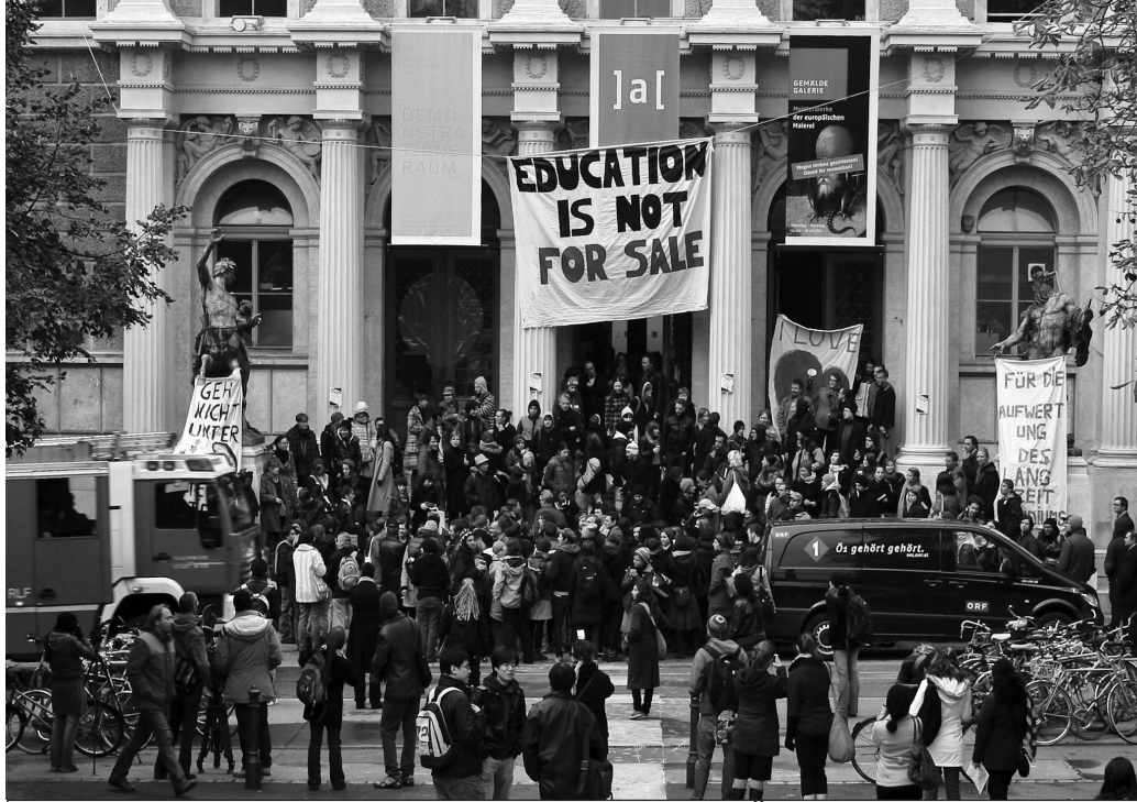
Bologna Sürecini protesto etmek için Viyana Üniversitesi’ni işgal eden öğrenciler, okul kapısına “Eğitim satılık değildir” yazılı pankart astılar.

Bologna Süreci elbette ki öncelikle Avrupa’da büyük bir ilerleme kaydetmiş durumda. “Bologna Süreci” ilerledikçe Avrupa üniversitelerinde direniş de yükselmiştir. Özelleştirme ve ticarileştirmeye karşı Almanya’dan İspanya’ya, İtalya’dan Yunanistan’a üniversiteler işgal edilmiş, ciddi eylemler olmuştur ve bu eylemler sürmektedir. Bologna sürecinin Türkiye’deki üniversite yaşamına etkileri de yavaş yavaş belirmektedir. Henüz ciddi bir direniş odağı gözükmesine de Bologna Süreci tam yol ilerlemektedir ve görülen odur ki afyon etkisi üniversiteyi sarmıştır.