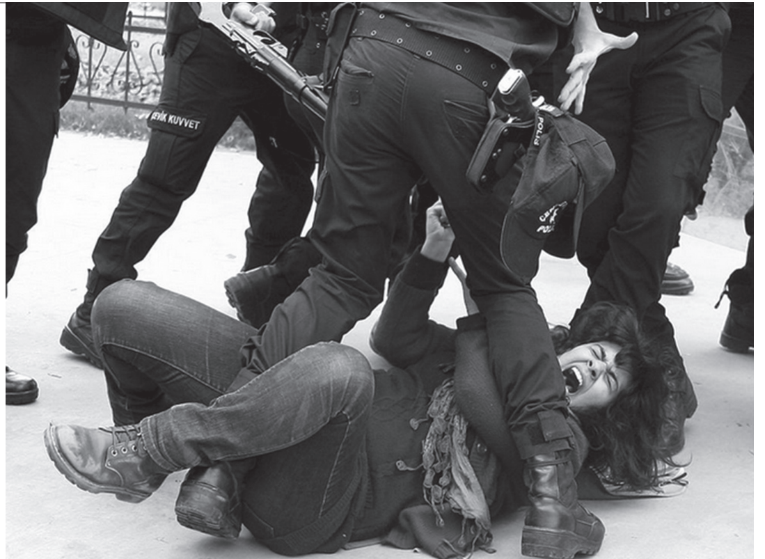
İstanbul Dolmabahçe'deki öğrenci eyleminde polis vahşeti...

Annenin suçu büyüktü. Hem evlenmeden hamile kalmış hem de eyleme katılmıştı. Genç anne ise bu suçlarından haberdar değildi. Sevdiğiyle bebeklerini dünyaya