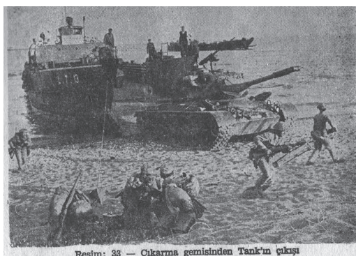
Resim: 33 — Çıkarma gemisinden Tanık'ın çıkışı

Bazılarının pek sevdiği sözde solcu Yalçın Küçük, 1974 harekâtında yedek subay olarak yer almıştı. Atilla Olgaç'ın bu açık-